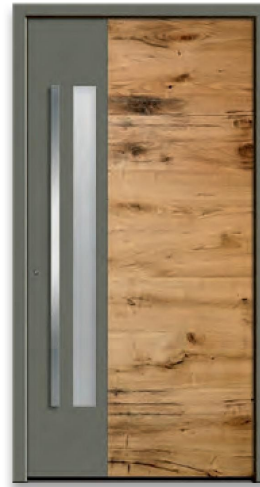
Model RES 405