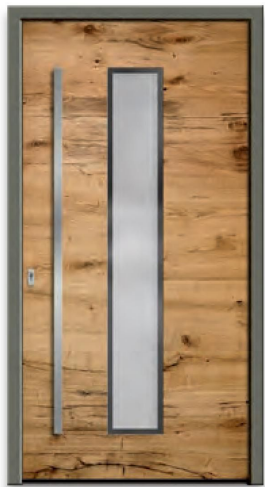
Model RES 402