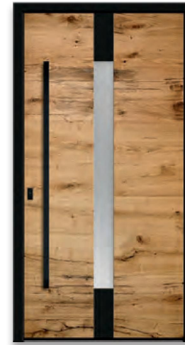
Model RES 406