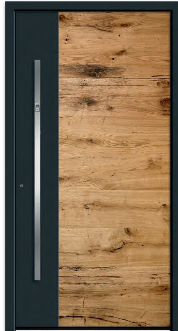
Model RES 404