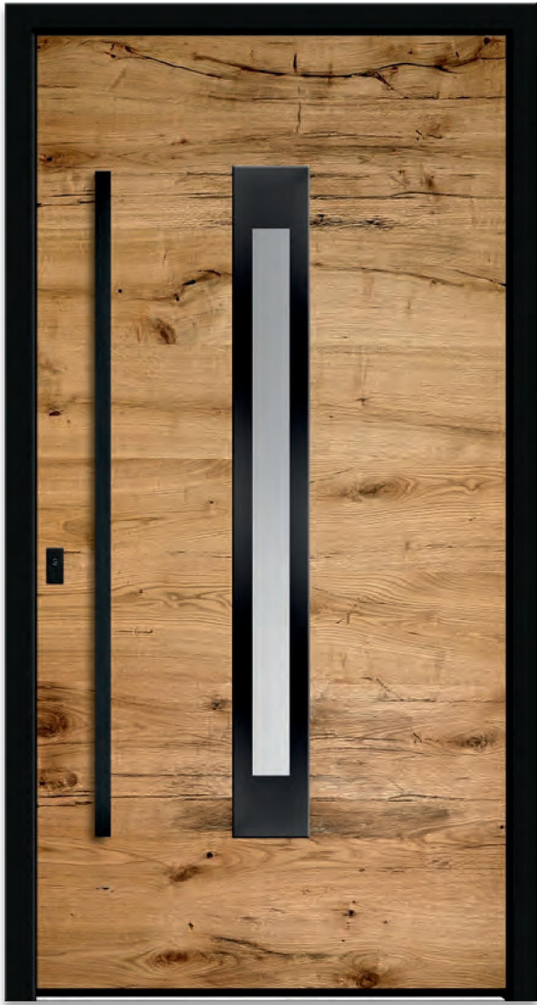
Model RES 400