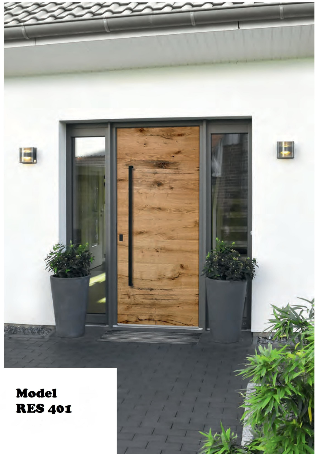
Model RES 401

Zbog individualnog goda drveta i njegove stukture, svaka ploča panela vrata uvijek je jedinstvena i unikatna.