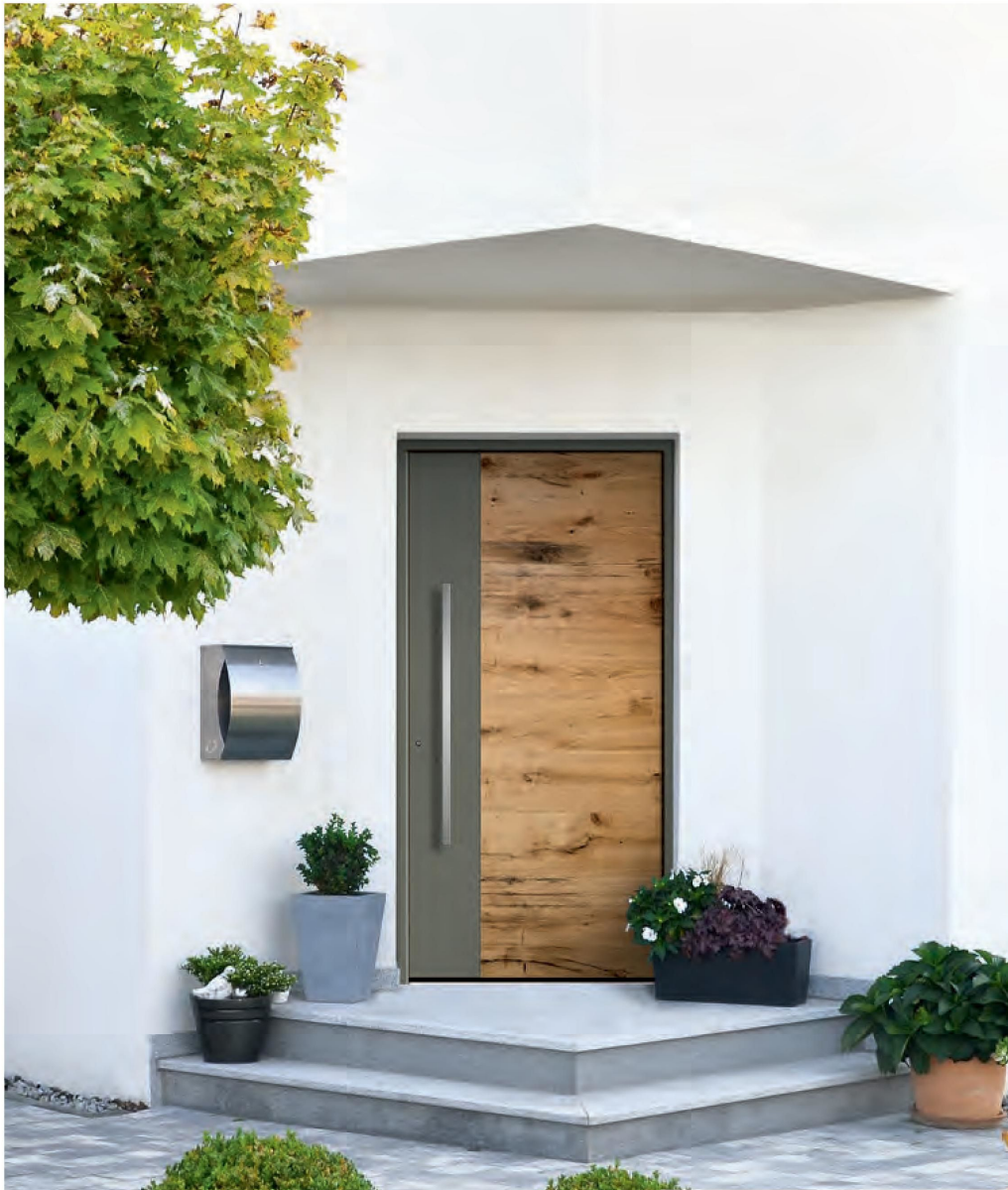
Model RES 405