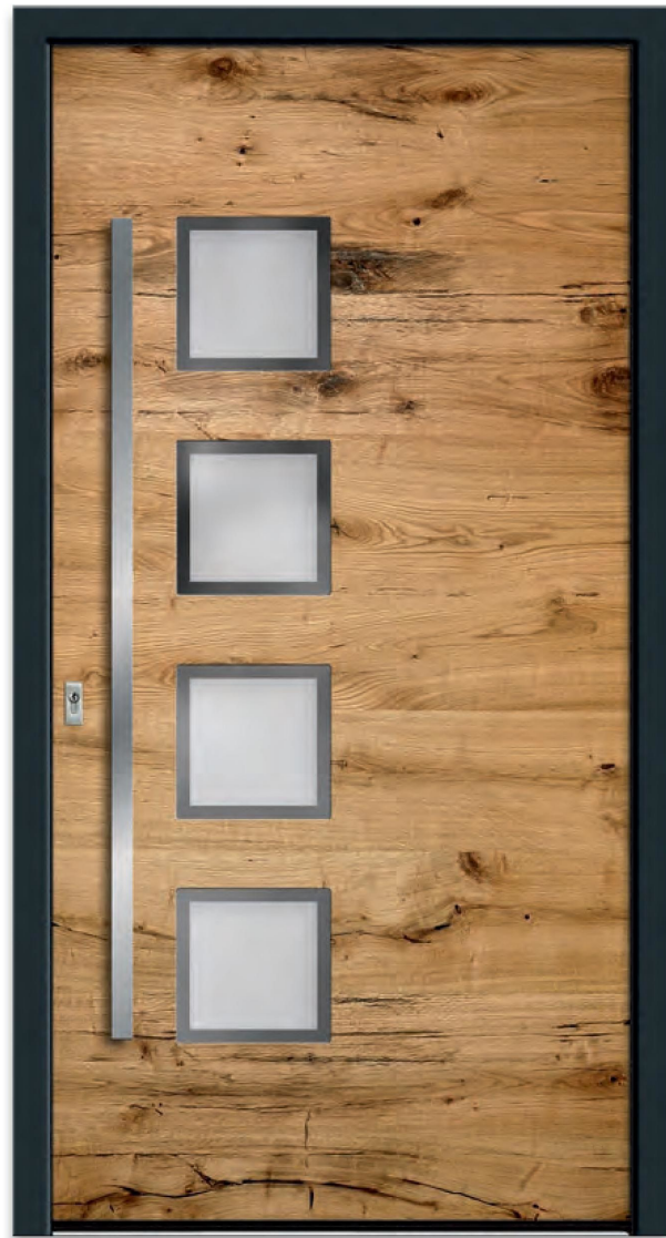
Model RES 403